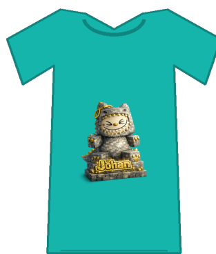
Kvar logo blir unik