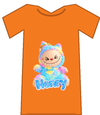
T-skjorte med eige motiv

Elevane lagar kule t-skjorter og handlenett med eigne motiv og logoar. Her er nokre døme på kva eit lite team kan produsere – frå idé til ferdig vare som kan seljast i bygda.